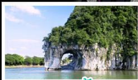
ฝางวงซ้าง