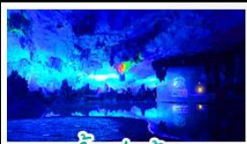
ถ้ำลุ่มย้อ

เขารู้อี+สะพานแดง - ล่องเรือแม่น้ำหลีเจียง ขานันบันไดสี่ทองอร่าม - กำลุ่มย้อ - ฝางวงซ้าง เจดีย์เงินเจดีย์ทอง - รถไฟความเร็วสูง เบบูพิเศษ บูฟพิเศษบาร์บีคิว ปลาอบเบียร์ เผือกคริสตัล สุกี่เห็น