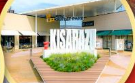
มิตซูเอะอิเกะ พาร์ค คิซะระซุ