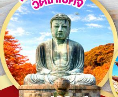
หลวงพ่อดาโอบุตสึ