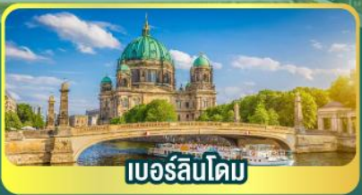
เบอร์ลินโดม