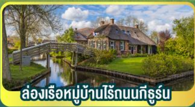
ล่องเรือหมู่บ้านไรกนทึร์น