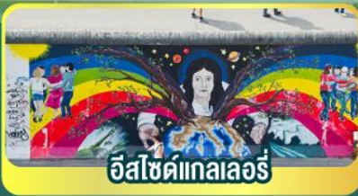
อิสซิดเทลเลอร์