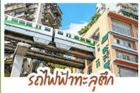
รถไฟฟ้าทะลุคอก

ชมธรรมชาติ ณ อุ้หลง ชมหุบเขาสุดอลังการระดับมรดกโลก นั่งรถไฟฟ้าทะลุคอกหลิงป้า สักยภาพเมืองวงซิงสุดล้ำ สัมผัสวิถีภูเขาหิมะแห่ง ภูเขาสี่ดรุณี งดงามจนได้รับฉายา "เทือกเขาเออลิปแห่งตะวันออก" ชมธรรมชาติสุดฟิน ณ อุทยานปี้เฉิงโกว • ซ้อปิงจู่ใจ ถนนคนเดินไต้กู่หลี่, ถนนคนเดินซุนซู่