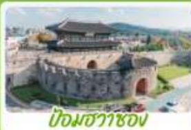
ป้อมฮวาซอง