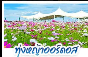
ทุ่งหญ้าแอร์ดอส