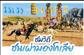
ชมวิถี ชนเผ่ามองโกเลีย

เปิดประสบการณ์ พักแรมมองโกเลียสุดพรีเมียมกลางทุ่งหญ้า สัมผัสบรรยากาศพระอาทิตย์ขึ้นสุดโรแมนติก ชมวิถีชนเผ่ามองโกเลีย พร้อมปาร์ตี้กองไฟใต้ท้องฟ้าเต็มไปด้วยดาว • ตะลุยทะเลทรายอินคินทาลา ถ่ายรูปสุดปังกลางทะเลทรายสีทอง • เที่ยวครบถึงทุ่งหญ้าแอร์ดอส วัฒนธรรมมองโกเลีย และเมืองสุดโมเดิร์นในกรุงเป่ย์จิง แบบสวยหรู คุณพึงทุกวินาที