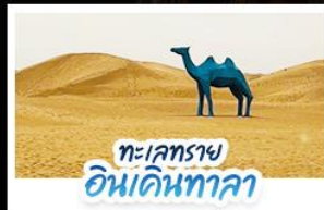
ทะเลทราย อินคินทาลา