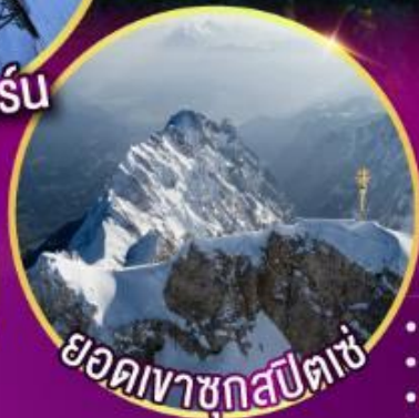
ยอดเขากุสปีตเซ่