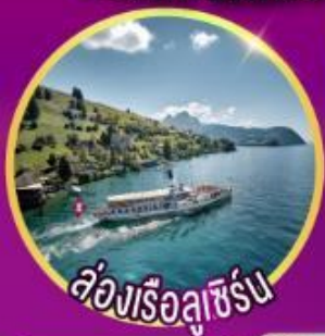
ล่องเรือลูเซิร์น