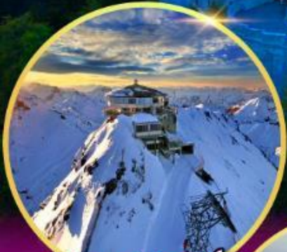
ยอดเขาซิลรอร์น