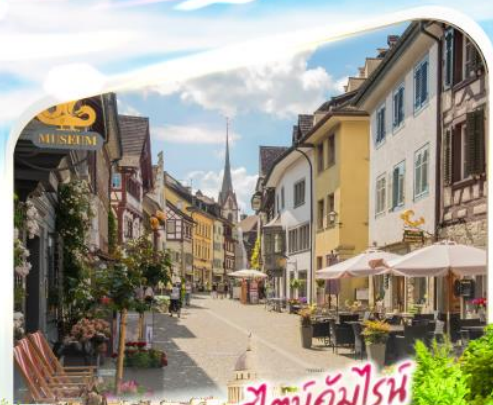
สถานีอัมไรน์