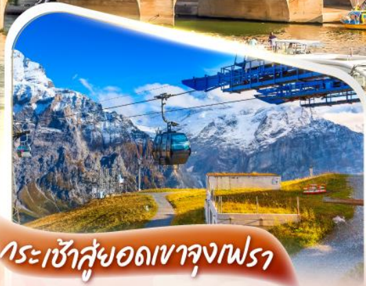
กระเช้าสู่ออดเขาจุงเฟรา