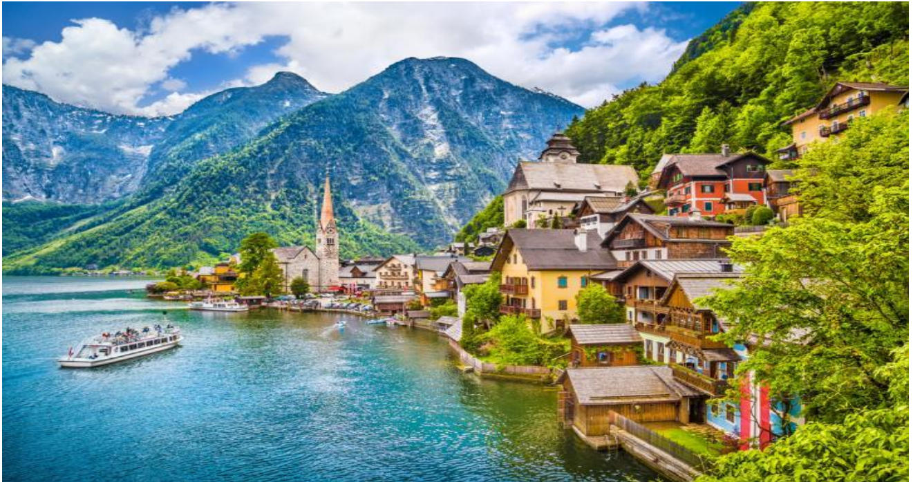
กลางวัน รับประทานอาหารกลางวัน ณ ภัตตาคารพื้นเมือง (ปลาจากทะเลสาบฮัลสตัดท์)