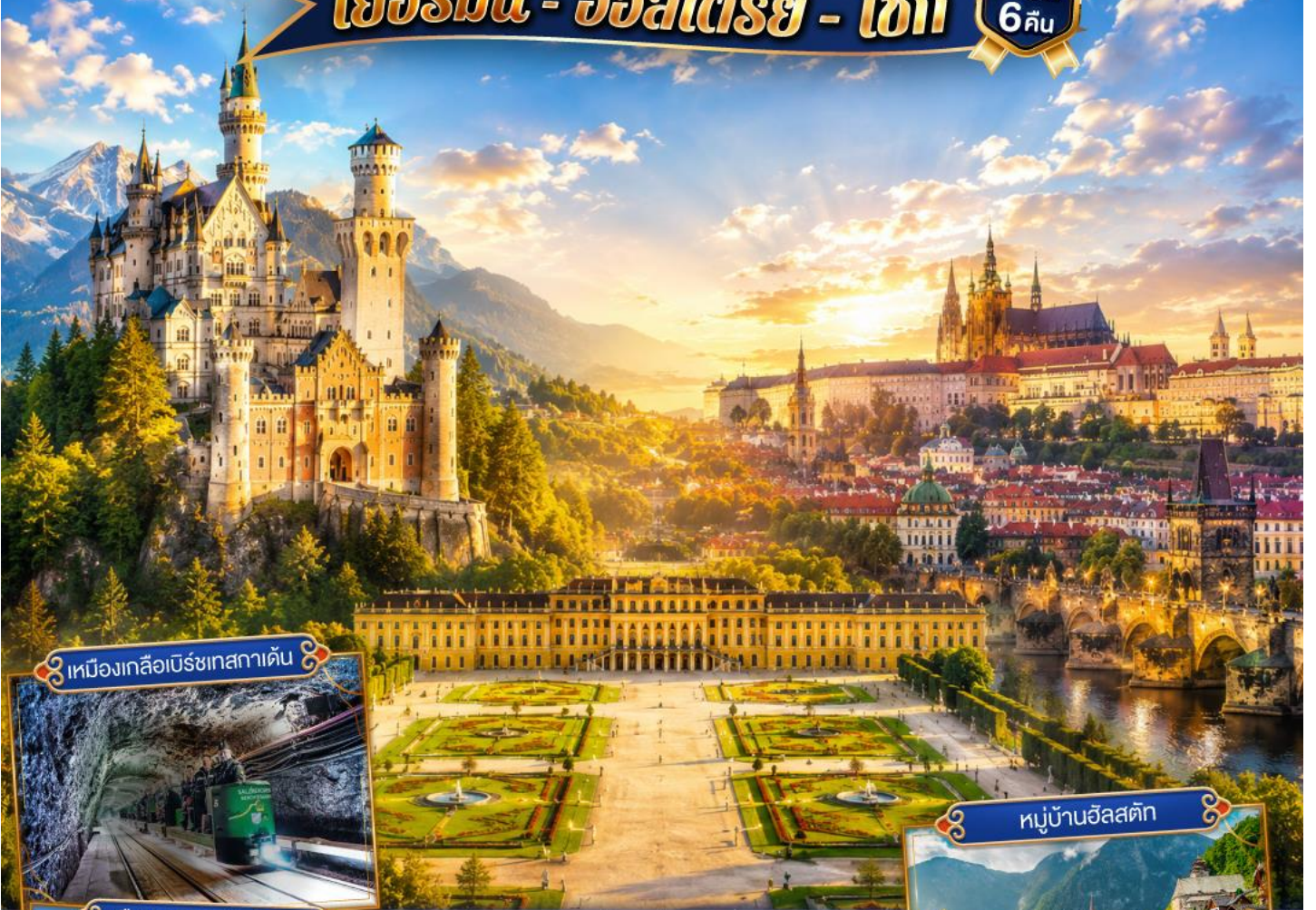
เหมืองเกลือมิร์เชลกาเดิน