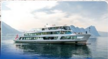
ล่องเรือทานอาหารกลางวัน ทะเลสาบลูเซิร์น