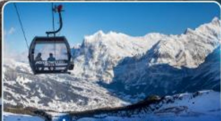
นั่งกระเช้าและรถไฟสู่ ยอดเขาจุงเฟรา