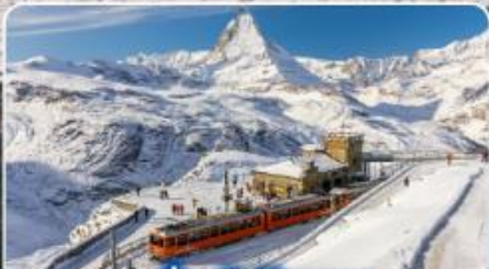
นั่งรถไฟสู่ยอดเขา กรอนเนอร์เกรท