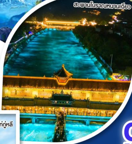
สะพานโบราณหนานเจียว