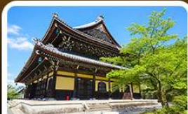
วัดนินเซ็นจิ