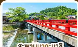
สะพานนากะบาชิ ทาดายาม่า