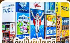
ช้อปปิ้งชินไซบาชิ และโคดงโบริ