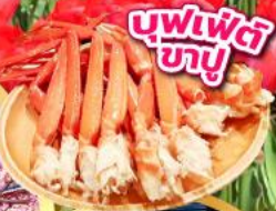
บุฟเฟ่ต์ ซาซู