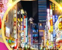
ช้อปปิ้ง ชินจูกุ