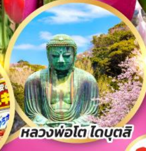
หลวงพ่อดโต โดบุตสึ

ชมเทศกาลดอกทิวลิป ณ สวนชาคุระฟูรุโนะซาโตะฮิโระะ พักออนเซ็นพร้อมบุฟเฟ่ต์ซาซู 1 คืน