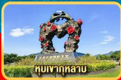
ทิวเขากุหลาบ