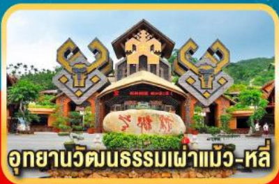
อุทยานวัฒนธรรมเผ่าแม้ว-หลี