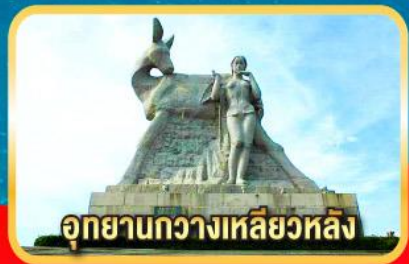
อุทยานกวางเหลียวหลิง

เมนูพิเศษ! ลิ้มรสไก่โหล่า, เซตซีฟู้ดกุ้งมังกร, ขันโตกข้าวเหนียวห้าสี, อาหารเจ ณ สวนพุทธธรรมหนานซาน