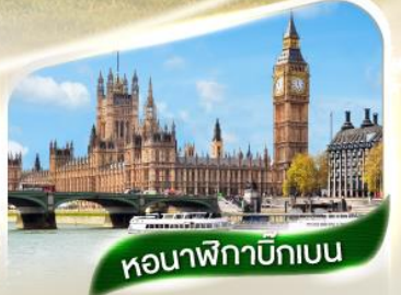
หอนาฬิกาบิ๊กเบน