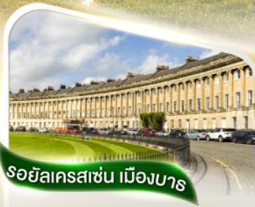
รอยัลคราซัน เมืองบาร