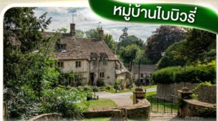
หมู่บ้านโบบิวรี่