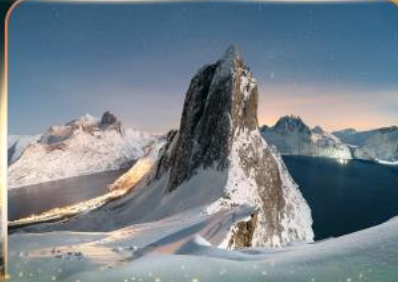
เกาะเซนญา