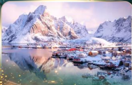
หมู่บ้านเรนเน