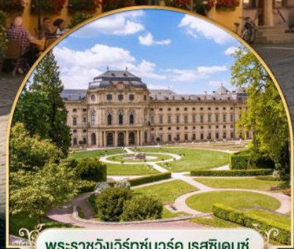
พระราชวังแวร์ซายส์ ฝรั่งเศส