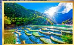
หุบเขาน้ำเงิน

พิเศษ! บุฟเฟ่ต์คุณหมิง, สุกี้ปลาแซลมอน, อาหารทูตทาน