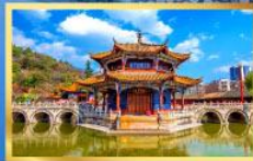
วัดหยวงทง

21-25 ม.ค. 69 28 ม.ค.-01 ก.พ. / 04-08 ก.พ. 69 04-08, 11-15, 18-22 มี.ค. 69