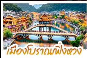
เมืองโบราณผิงเซว่ง