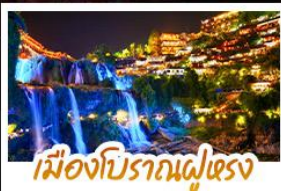
เมืองโบราณผู่เซว่ง