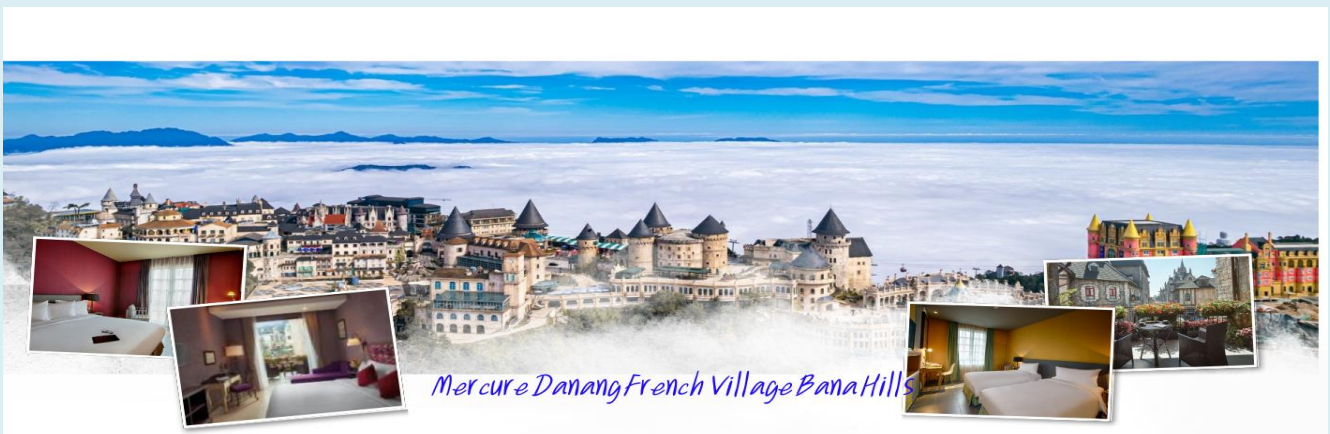
Mercurie Danang French Village Bana Hills

นำท่าน นั่งกระเช้าขึ้นสู่บานาฮิลล์ สัมผัสประสบการณ์ที่น่าตื่นเต้นพร้อมชมความสวยงามมากของธรรมชาติวิาวมสูง บานาฮิลล์ตั้งอยู่ในจังหวัดดานัง ประเทศเวียดนาม เป็นสถานที่ท่องเที่ยวที่มีชื่อเสียงและยอดนิยมนเป็นอย่างมาก และตัวกระเช้าลอยฟ้าเองยังมีความยาวที่สุดในโลกที่เชื่อมระหว่างเทือกเขาและยอดเขาอีกด้วย เมื่อท่านนั่งกระเช้าชมวิทิวทัศน์ที่สวยงามของภูเขาและป่าไม้ในระหว่างการเดินทาง นอกจากนี้บานาฮิลล์ยังมีสถานที่ท่องเที่ยวที่น่าสนใจมากมาย เช่น สะพานทอง (Golden Bridge) ที่มีลักษณะเป็นสะพานที่ถูกถือโดยมือยักษ์ รวมถึงสวนสนุกและรีสอร์ทต่างๆ ที่มีบรรยากาศสุดแสนโรแมนติก