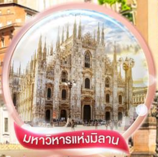
มหาวิหารแห่งมิลาน