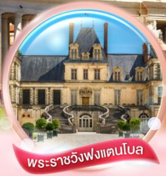
พระราชวังฟงแตนโบล