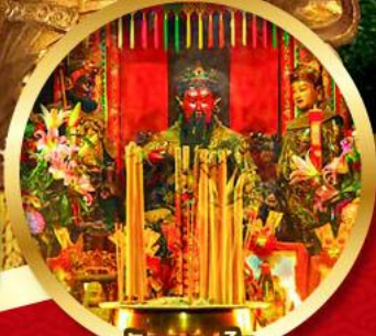
วัดกวนโถ

นมัสการองค์เจ้าแม่กวนอิม อายุกว่า 600 ปี