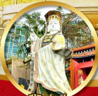
รีพัลส์เบย์