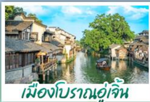
เมืองโบราณอู๋เจิน