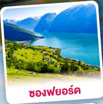
ช่องฟยอร์ด