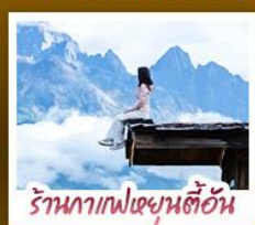
ร้านอาหารเขยูนตัน

ชมวิวกุหาหิมะหมยี่สุดโรแมนติกกับแสงยามพลบค่ำ เที่ยวเมืองโบราณต้าหลี่ ลี้เจียง ไปซา แซงกรี่ล่า ชมวิถีชีวิตของชนชนยูนนานและทิเบต พิสูจน์ความกล้าท้าเดินสะพานแก้วลี่เจียง • ซ้อปิ้งเพลินที่ถนนคนเดินหนานผิงเจียง