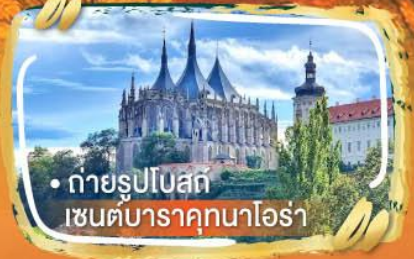
• ถ่ายรูปโบสถ์ เซนต์บาราคูนาออร์่า