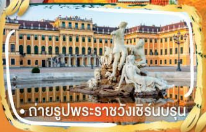
• ถ่ายรูปพระราชวังเชิร์นบรุน