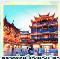
ตลาดร้อยปีเป่ิงหวังเมี่ยว