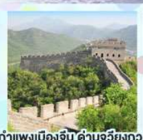
กำแพงเมืองจีน ด้านจวิงกวน