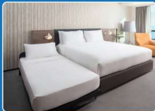
👤👤👤 TRIPLE (TRP)

**รูปภาพห้องพักเป็นเพียงภาพสื่อถึงประเภทของเตียงเท่านั้น ไม่ใช่ภาพห้องพักจริงสำหรับการเข้าพัก**