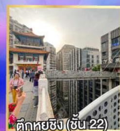
ตึกหุ่ยซิง (ชั้น 22)