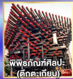
พิพิธภัณฑ์ศิลปะ (ตึกตะเกียบ)