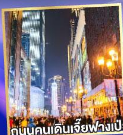
ถนนคนเดินเจียวฟางเป่ย์