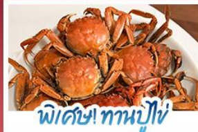
พิเศษ! ทานปูใหญ่

ปรากฏการณ์ธรรมชาติ 1 ปี มีแค่ครั้งเดียว! เตรียมชุดเก่งไปถ่ายรูปกับ 'หาดแดงผานจีน' ที่กำลังพร้อมสีแดงสดไปทั่วผืนน้ำ พร้อมฟินสุดขีดกับฤดูกาลทานปูที่คึกคักที่สุดแห่งปี • สัมผัสสวนสิริแห่งตะวันออกที่ต้าเหลียน