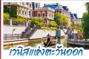
เวนิสแห่งตะวันออก