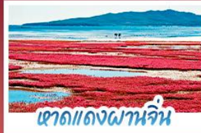
หาดแดงผานจีน