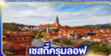
เซกัตครุมลอฟ