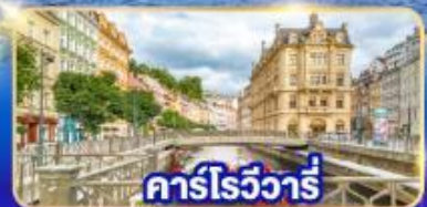
คาร์โรวัวร์