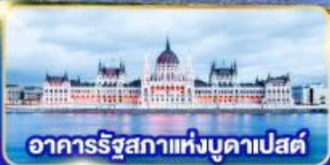
อาคารรัฐสภาแห่งบูดาเปสต์