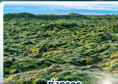
ทุ่งลาวา