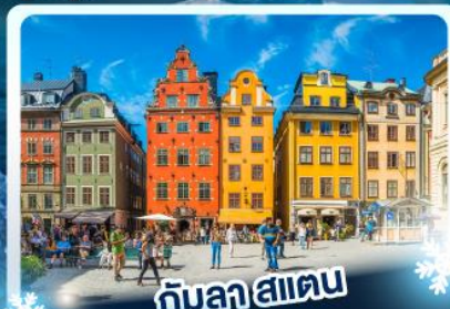
กับลาสาเตน