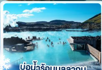
แช่น้ำร้อนบลูลากูน

เก็บไอซ์แลนด์ แคนกัวไฟเคิร์กจูเฟลา และ แช่น้ำร้อนบลูลากูน