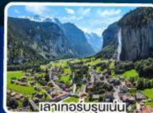
เลาเทอรับรุนเนน