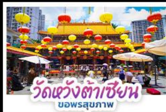
วัดเซว่งต้าซิงหน บอพรสุภภาพ