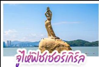
จูเซีฟิซาซอร์ทีกีริค