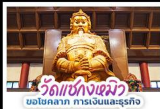
วัดแซ่กงเฉิว บอโชคลาก การเงินและธุรกิจ