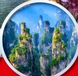
เขาอวดตาร