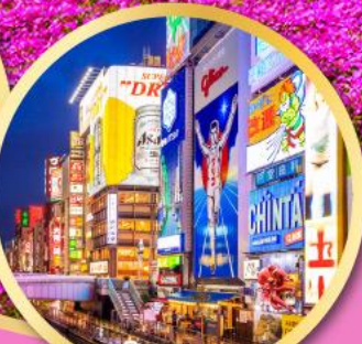
ช้อปปิ้งโดตงโบรี