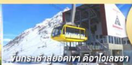
ขึ้นกระเช้าสู่ยอดเขา ดือาไวเลซซา