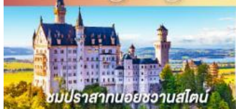
ชมปราสาทนอยชวานสไตน์