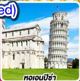
หอนอนปิซ่า