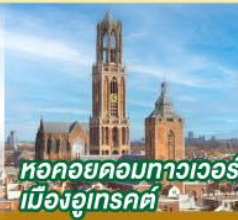
หอคอยคอมพิวเตอร์ เมืองอูเทรคต์