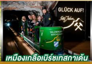
เหมืองเกลือบิรชเทสกาเดิน