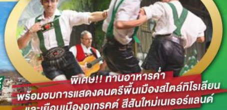
พิเศษ!! กำนอาหารค่ำ พร้อมชมการแสดงดนตรีพื้นเมืองสไตร์ท็โรเลียน และเยือนเมืองอูเทรคต์ สิ้นใหม่เนเธอร์แลนด์