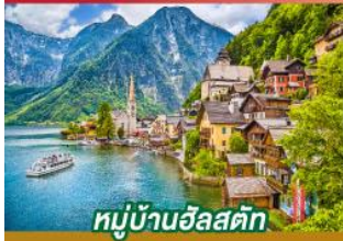
หมู่บ้านอัลสติก