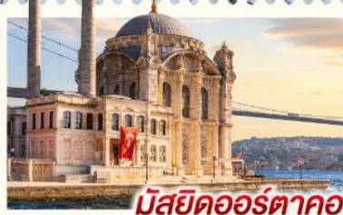
มัสยิดออร์ตาซอย