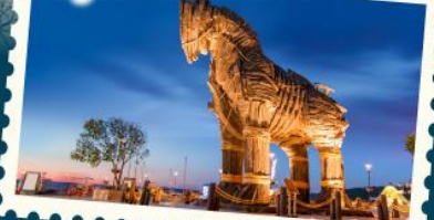
ถ่ายรูปม้าไม้แห่งทรอย

ขึ้นกระเช้าชมวิวสุหร่าออยบสุลค่าน และกระเช้ายอดเขาออร์ซียิส