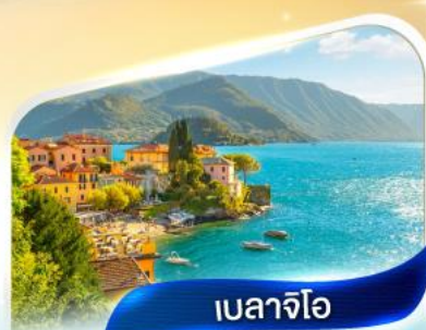
เบลลาจีโอ