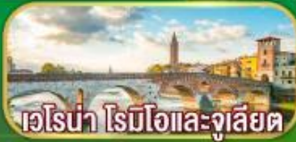
เวโรนา โรมีโอและจูเลียต

เดินทาง 07-14 เม.ย. 69 / 02-09 พ.ค. 69 27 พ.ค. - 03 มิ.ย. 69 / 17-24 มิ.ย. 69 22-29 ก.ค. 69 / 11-18 ส.ค. 69 16-23 ก.ย. 69