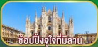
ซ็อบบิงจุงใจที่มีลาน