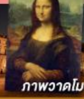
ภาพวาดโมนาลิซา