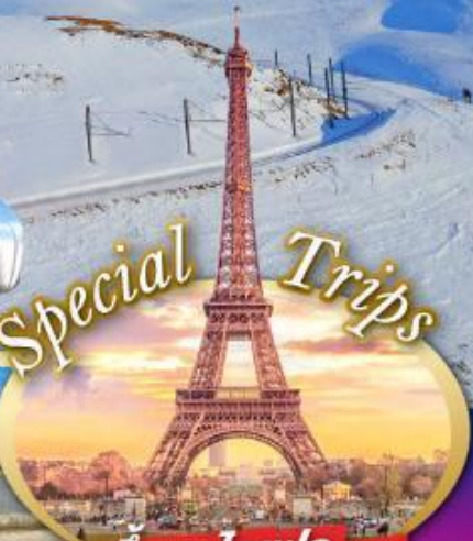
ขึ้นหอไอเฟล ชมความสวยงามของกรุงปารีส