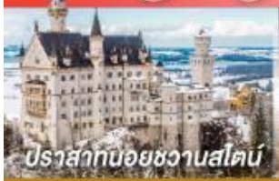
ปราสาทน้อยอชวานสไตน์