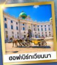
ฮอฟบวร์กเวียนนา