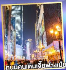
ถนนคนเดินเจียงฟางเป่ย์