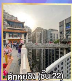
ตึกหุยซิง (ชั้น 22)