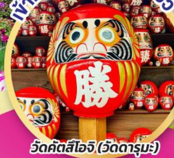
วัดคัตสึโฮจิ (วัดดาร์มมะ)