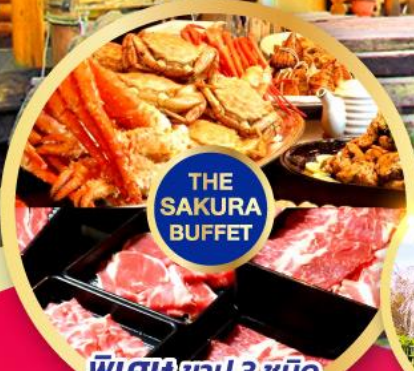
พิเศษ ซาซึ 3 ชนิด (ปูทะเล+หมู+ปูขม)