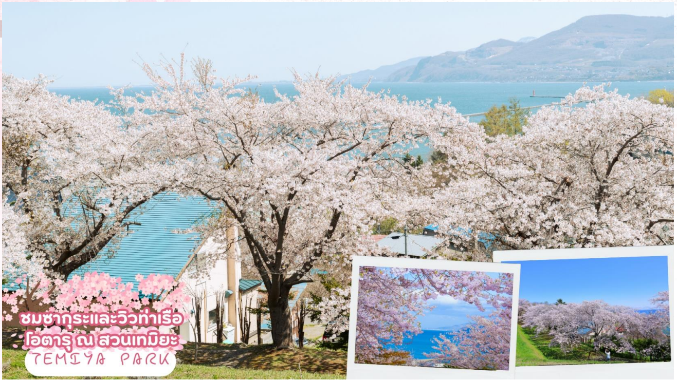
ชมซากุระและวิวท่าเรือ โอตารุ ณ สวนเทมิยะ TEMIYA PARK

ชมซากุระและวิวท่าเรือโอตารุ ณ สวนเทมิยะ (Temiya Park) เป็นหนึ่งในจุดชมดอกซากุระที่โด่งดังที่สุดในโอตารุในฤดูชมซากุระ อยู่บนภูเขา ช่วงฤดูดอกซากุระผู้คนจะหนาแน่น เนื่องจากที่นี่สามารถชมซากุระพร้อมกับชมทิวทัศน์ท่าเรือโอตารุ เหมาะสำหรับการพักผ่อนหย่อนใจและเพลิดเพลินกับวิวทะเลและดอกซากุระ โดยซากุระจะเริ่มบานในช่วงปลายเดือนเมษายนถึงต้นเดือนพฤษภาคม (ซากุระขึ้นอยู่กับสภาพอากาศของแต่ละปี)