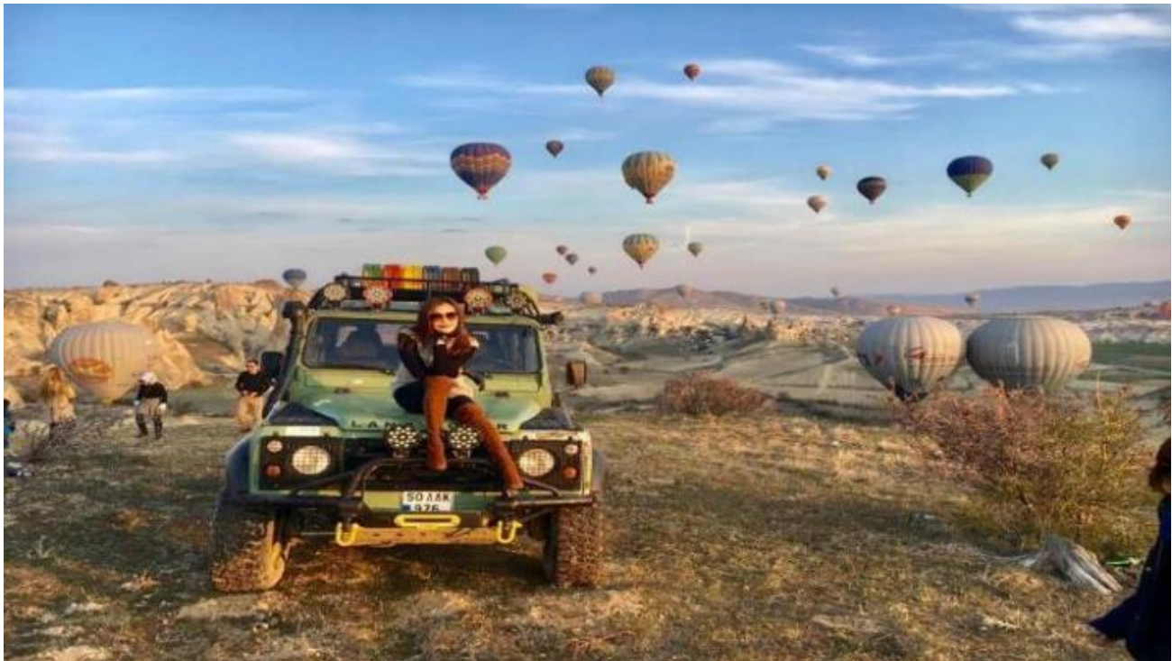
3. Classic Car นั่งรถคลาสสิก เปิดประทุน สูดอากาศ เย็น สดชื่น พร้อมชมบอลลูนสีสดใส วิวเมืองคัปปาโดเกีย ค่าใช้จ่าย 120 USD / ท่าน