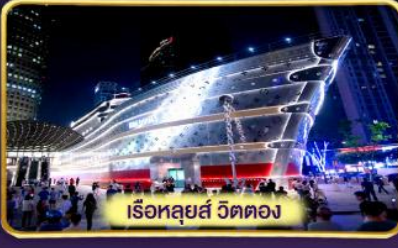
เรือหลุยส์ วิตตอง