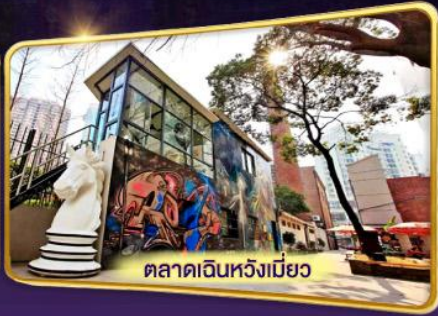
ตลาดเงินหวังเปียว