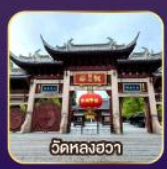
วัดหลงฮวา