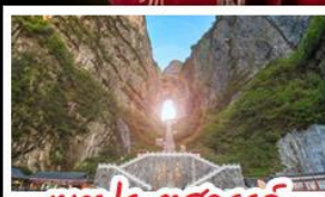
เขาประตูสวรรค์