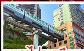
รถไฟทะลุคัง