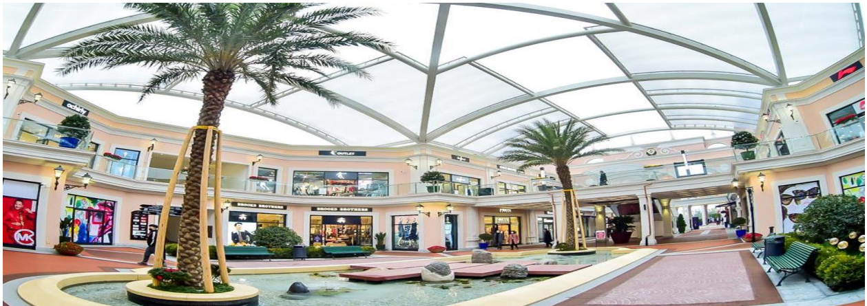
สมควรแก่เวลานำท่านเดินทางสู่ สนามบินฉิ่งเจียงเป่ย์

พาท่านแวะ ช้อปปิ้ง Outlet ที่ได้รับความนิยมมากที่สุด เป็นศูนย์รวมแบรนด์แฟชั่นและสินค้าลดราคาขนาดใหญ่ที่นักท่องเที่ยวและชาวเมืองนิยมมาช้อปปิ้งตลอดทั้งปี ภายในตกแต่งสไตล์ยุโรปสวยงามศิลปะสมัยใหม่ ให้ความรู้สึกหรูหราแต่เดินสบาย มีร้านค้าหลากหลายตั้งแต่แบรนด์กีฬาอย่าง Nike และ Adidas ไปจนถึงแบรนด์แฟชั่นและกระเป๋าชื่อดังอย่าง Coach และ Michael Kors จึงเหมาะทั้งสำหรับนักช้อปปิ้งสายสปอร์ตและผู้ที่กำลังมองหาสินค้าแบรนด์เนมราคาดี ภายในรวบรวมแบรนด์แฟชั่นระดับพรีเมียมมากมาย ไม่ว่าจะเป็น Furla, Ferragamo, Armani หรือ Jimmy Choo ทำให้ที่นี่กลายเป็นจุดหมายยอดนิยมของสายแฟชั่นและนักท่องเที่ยวที่ชื่นชอบการถ่ายภาพ