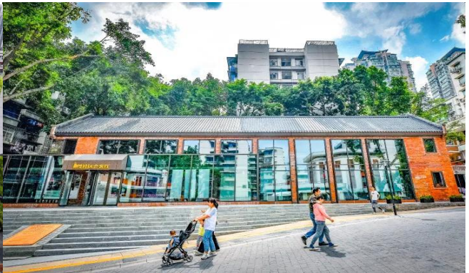
กลางวัน รับประทานอาหารกลางวัน ณ ภัตตาคาร (มือที่ 11)

นำท่านเดินทางสู่ ถนนคนเดินเอ๋อหลิง จากโรงงานพิมพ์ธนบัตร สู่แลนด์มาร์กศิลปะสุดฮิปแห่งฉงชิ่ง ท่ามกลางภูเขา ถนนลาดชัน และตึกสูงอันเป็นเอกลักษณ์ของมหานครฉงชิ่ง มีสถานที่แห่งหนึ่งที่สะท้อนเสน่ห์ของ “เมืองเก่าและเมืองใหม่” ได้อย่างสมบูรณ์แบบ นั่นคือ “TESTBED2” แลนด์มาร์กสายอาร์ตที่กำลังกลายเป็นหัวใจของวัฒนธรรมสร้างสรรค์ในเมืองฉงชิ่ง เดิมทีสถานที่แห่งนี้เป็น “โรงพิมพ์ธนบัตรกลาง” ที่ก่อตั้งขึ้นในปี 1937 ในยุคสาธารณรัฐจีน ก่อนจะเปลี่ยนชื่อเป็น โรงพิมพ์หมายเลข 2 ของฉงชิ่งในปี 1953 ซึ่งเคยเป็นศูนย์กลางงานพิมพ์ที่สำคัญที่สุดแห่งหนึ่งของจีนตะวันตกเฉียงใต้ ทั้งธนบัตร แสตมป์ ตั๋ว และเอกสารราชการจำนวนมาก ล้วนเคยถูกผลิตจากที่นี่