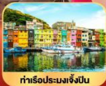
ท่าเรือประมงเจิ้งปิ่น